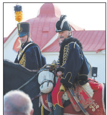
POPRVÉ na pouť přijeli i dva husaři.