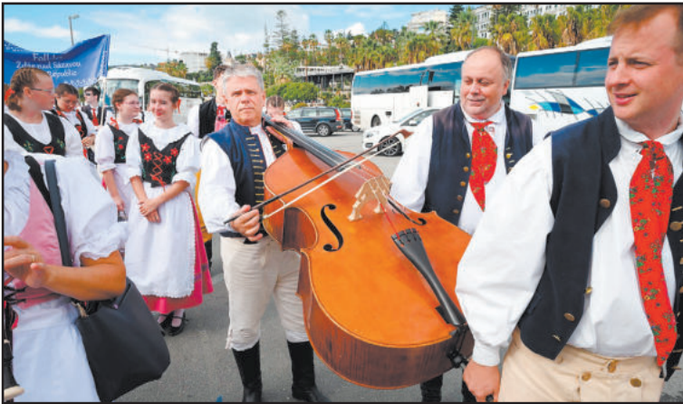
CESTOVÁNÍ s basou: San Remo, Itálie