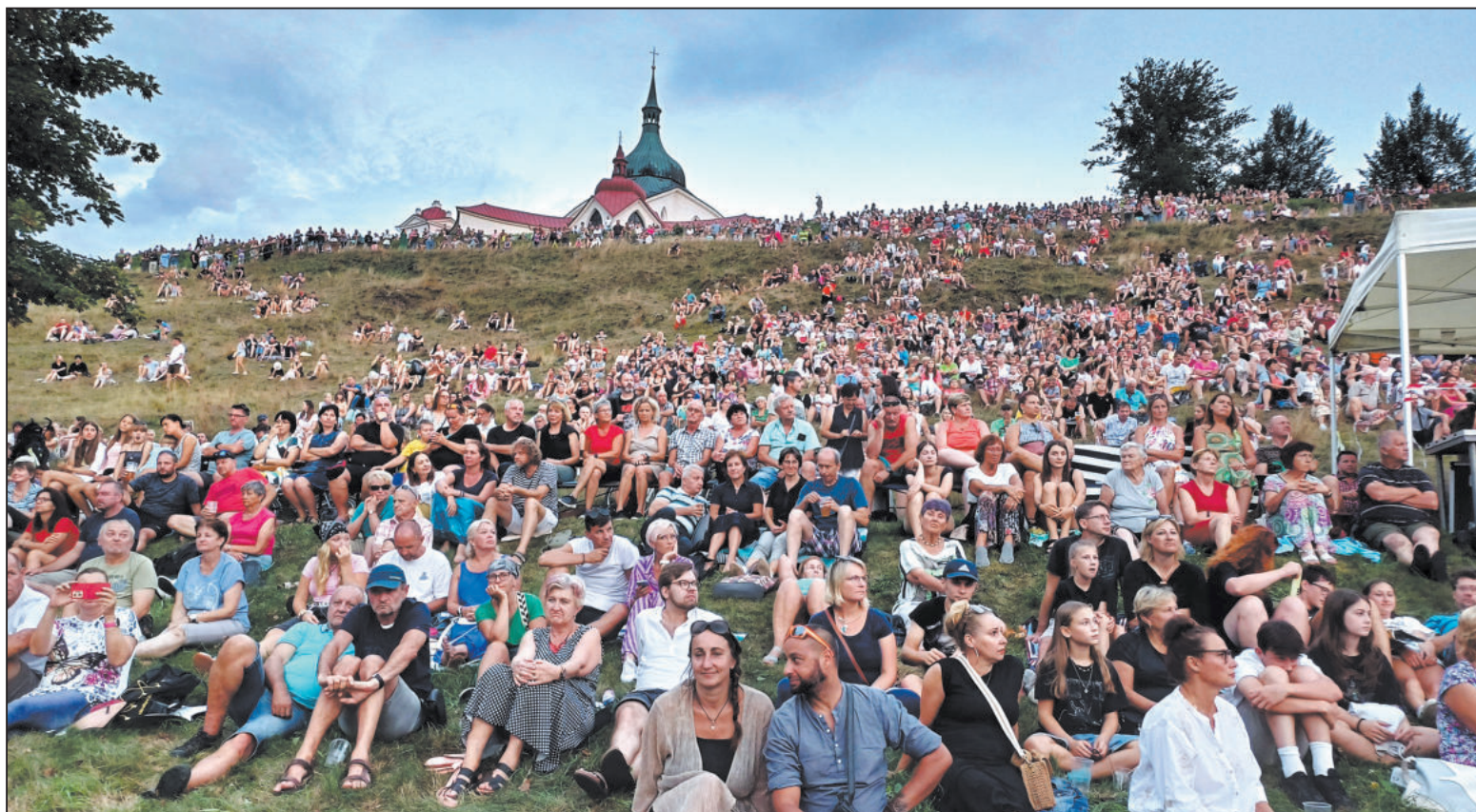
Zelená hora obsazená diváky a koncert Vojty Dyka na vodní hladině pod ní. Zázitek, na který lidé jen tak nezapomenou. (Více snímků v naší fotogalerii www.jihlavske-listy.cz/ZN )