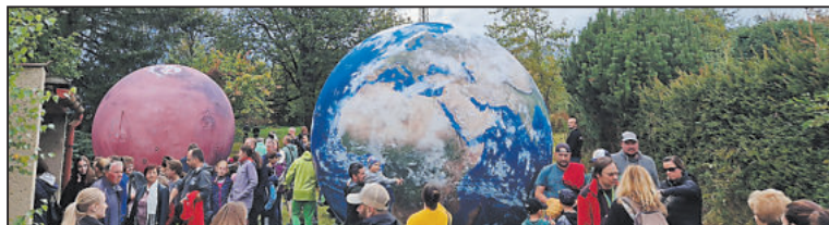
JEDNA z akcí hvězdárny pro veřejnost v minulosti.