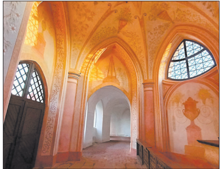
POHLED do zelenohorského ambitu z Německé kaple.