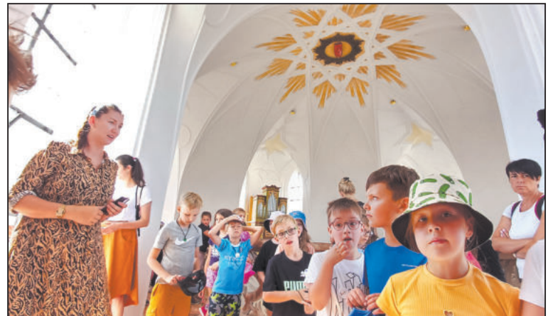
ZÁŽITKEM táborníků byl výstup až pod kopuli kostela se symbolem jazyka. Více snímků v naší fotogalerii ( www.jihlavske-listy.cz/ZN )

Děti se v táboře dozvěděly i zajímavosti o dalších Santiniho stavbách na Vysočině a z kostek vystavěly vlastní