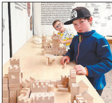
KRÁSNÉ stavebnice vybízí k postavení vlastní tvrze.

Malí i velcí návštěvníci si mohou v interaktivní části výstavy postavit