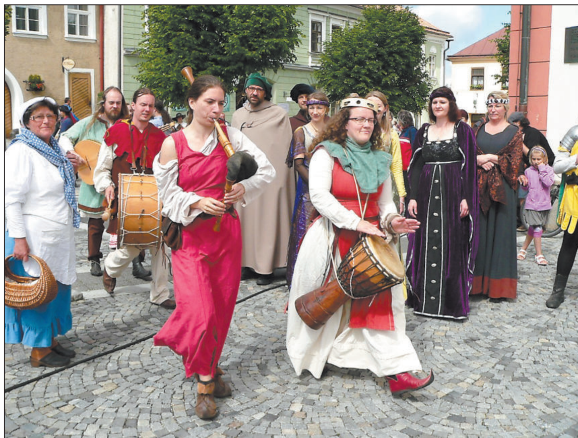
HISTORICKÝ průvod bývá velkým tahákem Dne Žďáru. Letos to bude průvod masek v režii Společnosti historického šermu Flamberg.

Ve válce o habsburské dědictví (1740-1742) zřídili v obci velký císařský polní lazaret pro všechna bojiště. Lazaret byl i v Polné. Nákaza tyfu a cholery mezi zraněnými, a nakonec i morová nákaza, zkosila i nízkovské obyvatelstvo, hroby byly