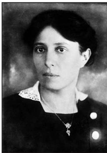
ALICE MASARYKOVÁ, první předsedkyně ČČK

Sociální i hygienické poměry zejména ve východních částech ČSR vyžadovaly rychlou reakci. V Obecním domě v Praze od února 1919