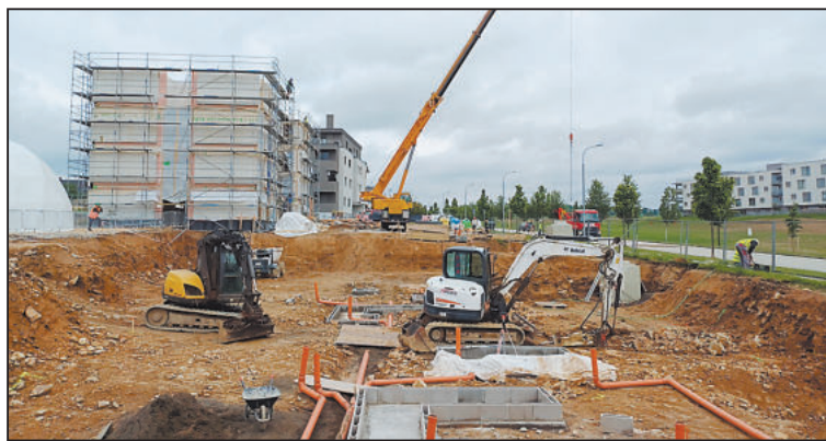
V SOUSEDSTVÍ dřevostavby (v pozadí) již technika bagruje základy pro druhý dům.

Zvláště, když je ČR již pár let v dostupnosti bydlení tzv. na chvostu EU. „Se Slovenskem se dělíme o poslední pomyslnou příčku v tom, kolik běžná domácnost potřebuje měsíčních platů na pořízení průměrného bytu,“ komentuje. A tak ČS založila před zhruba třemi roky dceřinou společnost Dostupné bydlení.