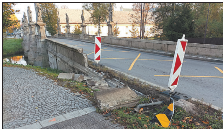
POŠKOZENÝ nájezd na historický most po dopravní nehodě s vlivem alkoholu.

Řidiči mířící k zámku musí počítat s dopravní komplikací na barokním mostě. Kvůli jeho letní opravě zde budou v určitých fázích provoz řídit kyvadlově semaforey. Oprava částečně omezí zdejší dopravu asi na 12 dní.