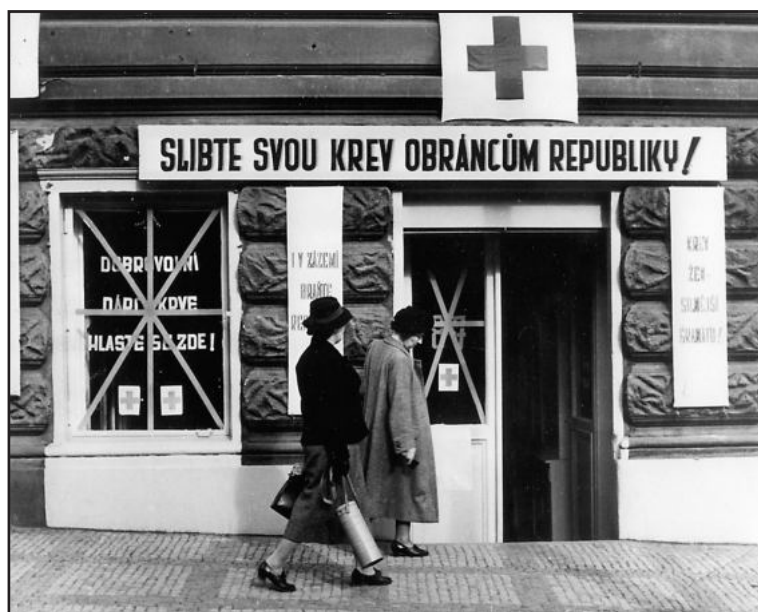
VÁLEČNÁ výzva pro dobrovolné dárcy krve