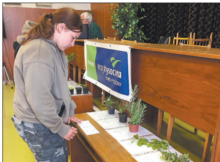
SOUČÁSTÍ soutěže mladých zahrádkářů bylo i poznávání rostlin.

Soutěž uspořádalo Územní sdružení Českého zahrádkářského svazu (ČZS) Žďár nad Sázavou za finanční podpory Kraje Vysočina a Ministerstva zemědělství ČR.