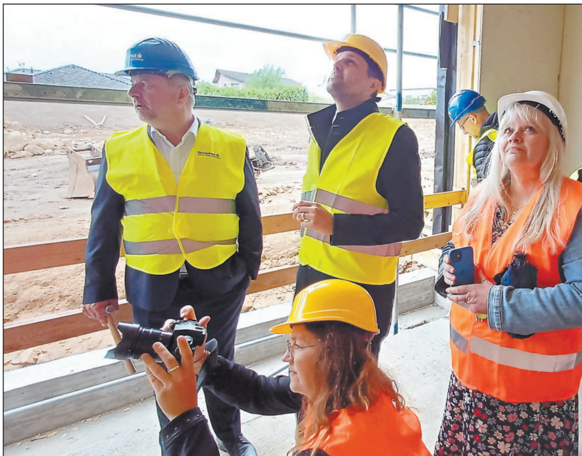
PROHLÍDKA stavby bytového domu, který je dřevostavbou. Druhý zleva ministr životního prostředí Petr Hladík.

V pátek 28. června také na městských školách naposledy zazvoní školní zvonek pro celkem 258 devátáků. Po prázdninách dají svému dalšímu vzdělávání nový směr. -lko-