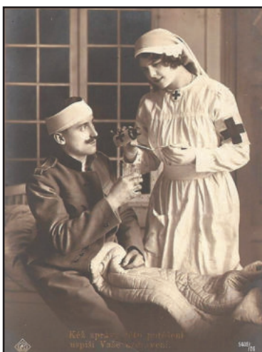
DOBOVÝ plakát o práci dobrovolných sester v 1. sv. válce

zasedali sociální pracovníci, zástupci armády i kulturního života. Se svými plány na založení Československého červeného kříže se velmi angažovala prezidentova dcera Alice Masaryková. Měla za sebou roky práce v sociální a zdravotní oblasti a také zkušenosti z Vlasteneckého pomocného spolku pro Království české. Působila i ve zdravotním výboru prozatímního československého parlamentu.