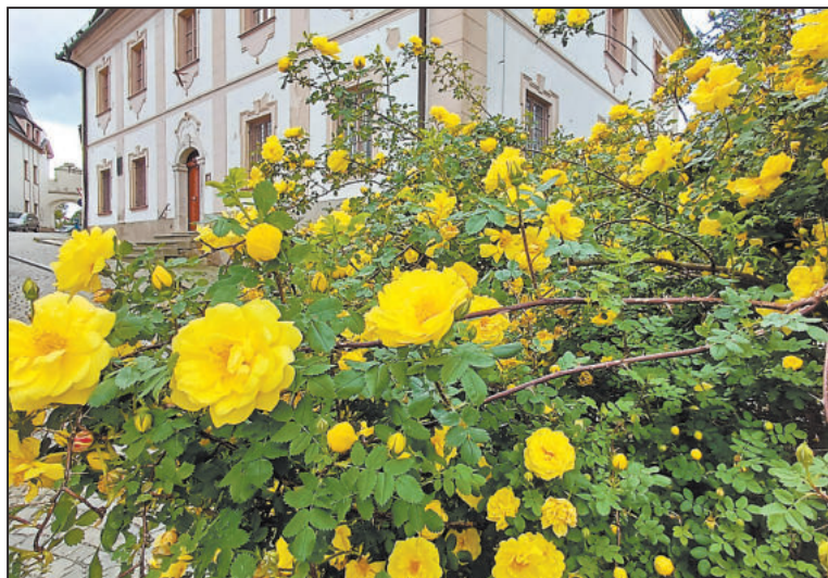
VZÁCNÁ růže Hugova před Moučkovým domem již kvete a Den Žďáru může začít. Žlutá voňavá záplava jej provází každoročně.

Novodobou tradicí, která otvírá léto v našem městě, je Den Žďáru.