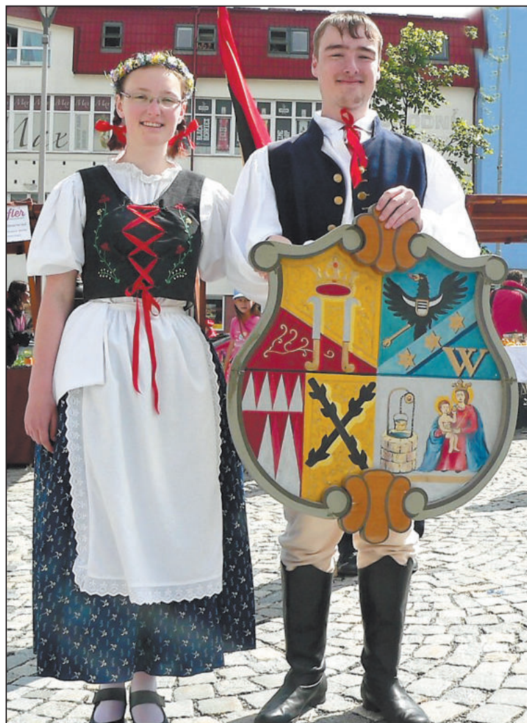
Den Žďáru bývá oslavou historie, moderna i folklóru. Vzpomínka na rok 2017.

11.30 Folklorní soubory Bystřinka a Rozmarýnek; Muzička Josefka