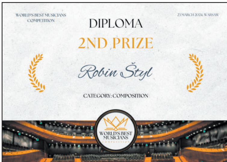
DIPLOM, který Robin Štyl nedávno získal za 2. místo v mezinárodní skladatelské soutěži.

tr, populární orchestr nebo popř. jen klavír,“ přibližuje.