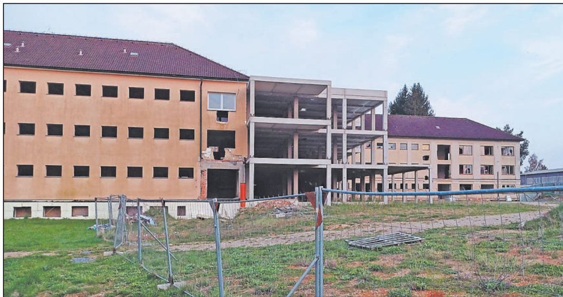
KRÁSNOU projekt, rozsáhlé objekty. Škoda, že chátrají nedokončené.

Na staveništi, které již v začátku zaznamenalo problémy se statikou původní budovy včleněné do celkového areálu, se již několik let nic neděje a bezpečnostně nezajištěné