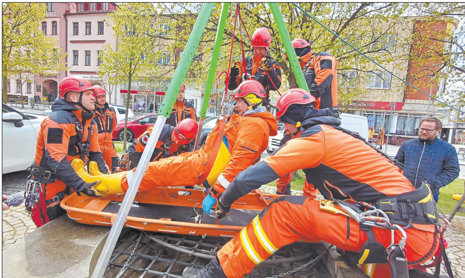
U STŘEDOVĚKÉ studny na náměstí bylo nedávno rušno. Hasičští lezci zde trénovali záchranu přiotráveného člověka. Více snímků z akce najdete v naší fotogalerii na: www.jihlavske-listy.cz/zn .