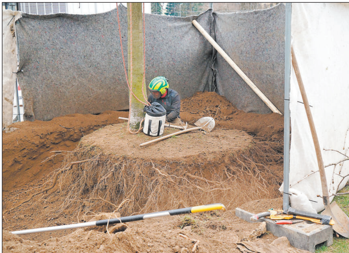
VZDUŠNÝ rýč je nová technologie přesazování stromů. Na snímku jirovec před poliklinikou s již obnaženými kořeny. Nyní roste v parku na Libušíně.

Přesazení většího stromu zabere 10–12 hodin. Na novém místě dostane strom šanci na uchycení, nechybí pravidelná závlivka. Agrotechnické lhůty pro pře-