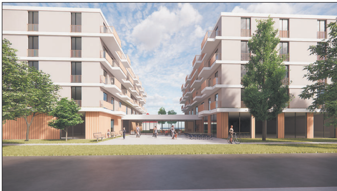
VIZUALIZACE budoucích družstevních domů: 1) Seniorský dům na Okružní horní. 2) Namísto klubu Batyskaf vyrostě dům pro rodinné bydlení (snímek dole).

Kolik lidí nakonec půjde do závazné rezervace, která proběhne nejdéle ve druhé polovině letoš-