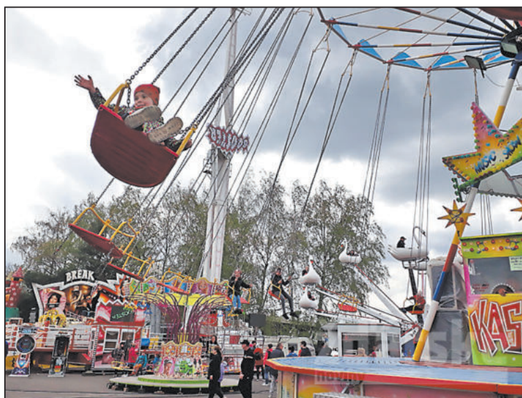
KLASICKÝ kolotoč prostě k pouti patří.

Ani letos nebudou chybět moderní atrakce jako Extrem-Booster, Break Dance, adrenalinové atrakce jako obří vyhlídkové kolo nebo Bungee