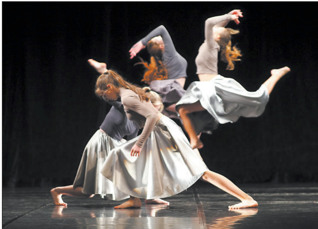
TITANIUM. Tanec, s nímž žďárské tanečnice jedou 8. 6. na slavnost ZUŠ Open do pražské Valdštejnské zahrady. Snímek je z pololetního koncertu tanečního oboru.

Jak přibližuje jejich učitelka Hana Ludvíková, předvedou dva tance. Šest dívek ve věku 13 a 14 let předvede tanec s názvem Nahlas, na píseň C.