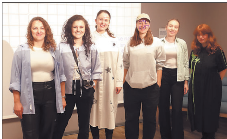
ŠEST dobrovolnic, které se starají o chod Spolku FŠEM.

Setkání s názvem Svačina FŠEM první listopadovou sobotu byla určena pro všechny, kteří by se rádi