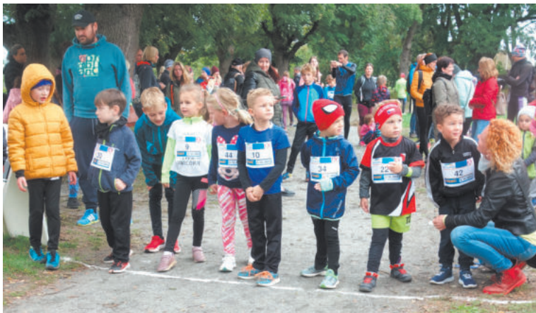
NA START v Tyršových sadech se šel všechny generace.