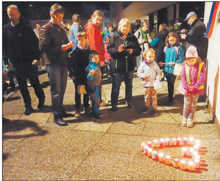
PŘED památkem na divadle Pasáž vytvořili sokolové srdíčko.