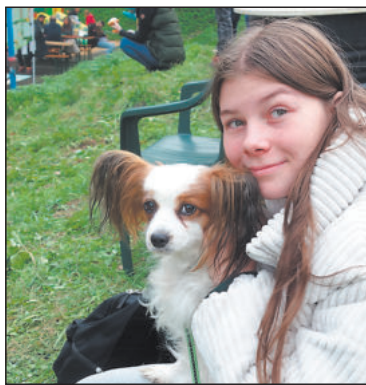
TAKHLE vypadá spokojený pesek u svojí paničky.

To vše jsme se dozvěděli v neděli 6. října krátce před polednem v Libušině údolí v Třebíči, kde se konal čtvrtý ročník akce Kapka pro tlapy. Modelování se ujal tradičně Milan Řezníček a tradičně nezklamal. Jeho dovádění s dětmi bylo příkladné pro všechny dospěláky.