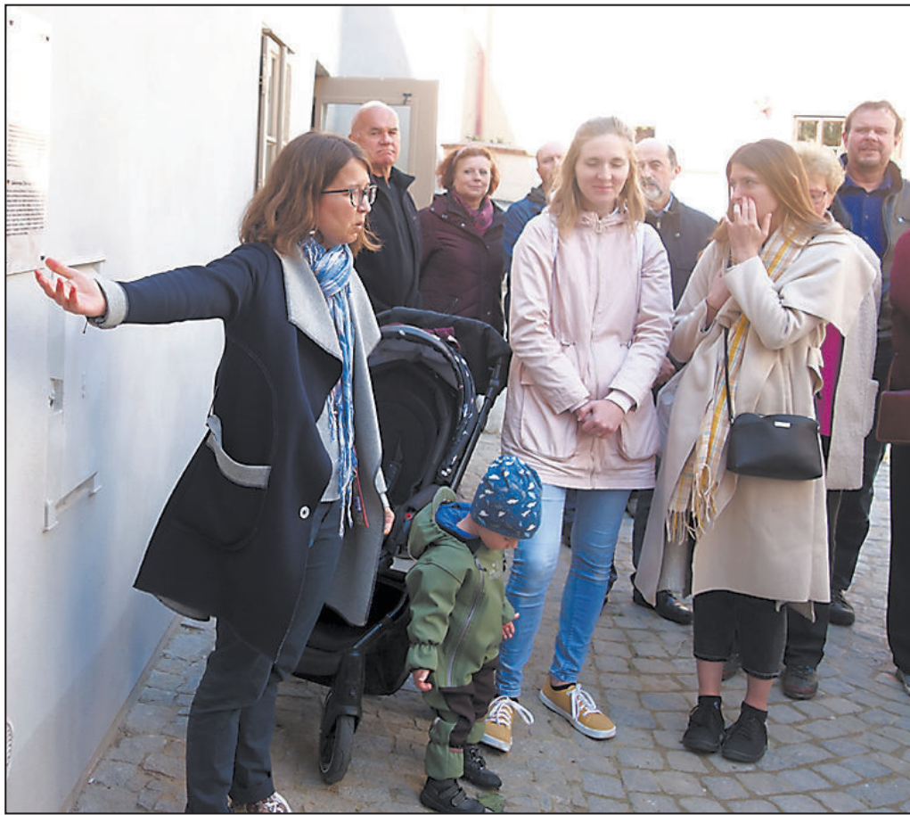
PRVNÍ možnost prohlédnout si židovskou čtvrť trochu jinak vzbudila velký zájem.

S ohledem na moji cennou historii jsem byl