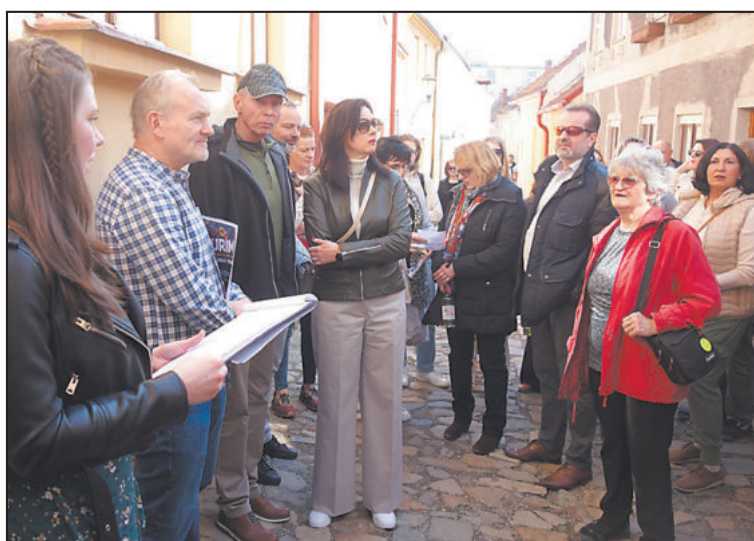
RAČTE vstoupit do opraveného domu rabína na Tichého náměstí v Třebíči.