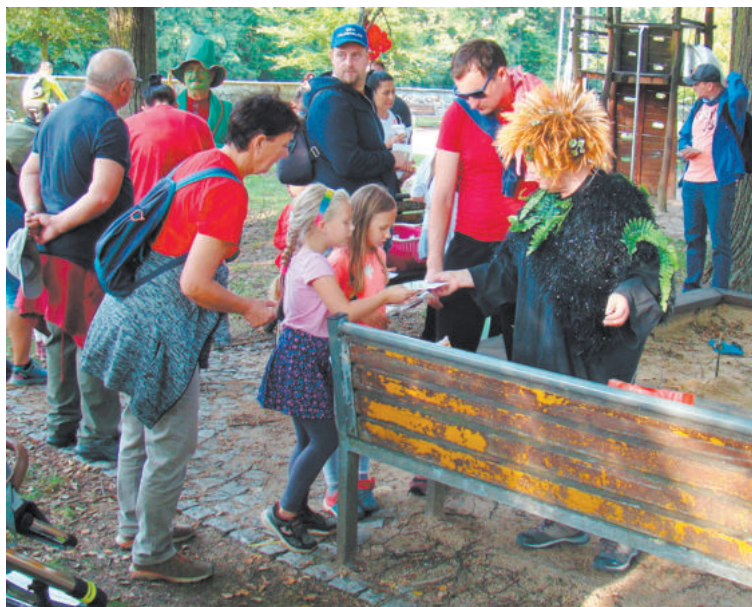
POHÁDKOVÁ Třebíč patří k oblíbeným akcím.

Cesta pokračovala po nábřeží řeky Jihlavy směrem k zámku, na nádvoří účastníky přivítali rytíř, princezny a žabák, děti opět čekaly hry a sladkosti. Ze zámku pochod pokračoval přes Židovskou čtvrt na Hrádek, tam měli stanoviště Slunečník, Měsíčník, Větrník a Večernice a děti hledaly ztracené hvězdy Večernice.