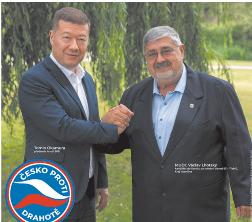
Tomio Okamura předseda hnutí SPD

starosta Okříšek a kandidát do Senátu za Třebíčsko