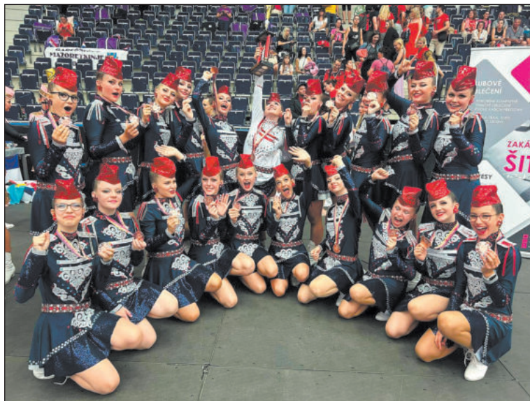
VELKÁ radost panovala mezi mažoretkami na Mistrovství Evropy v Liberci.

Mladší děvčata získala Titul II. VICEMISTRYNĚ EVROPY v mini-