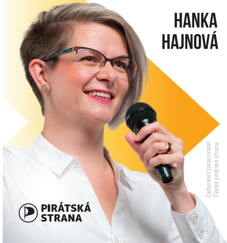
Zadavatel/zpracovatel Česká pirátská strana