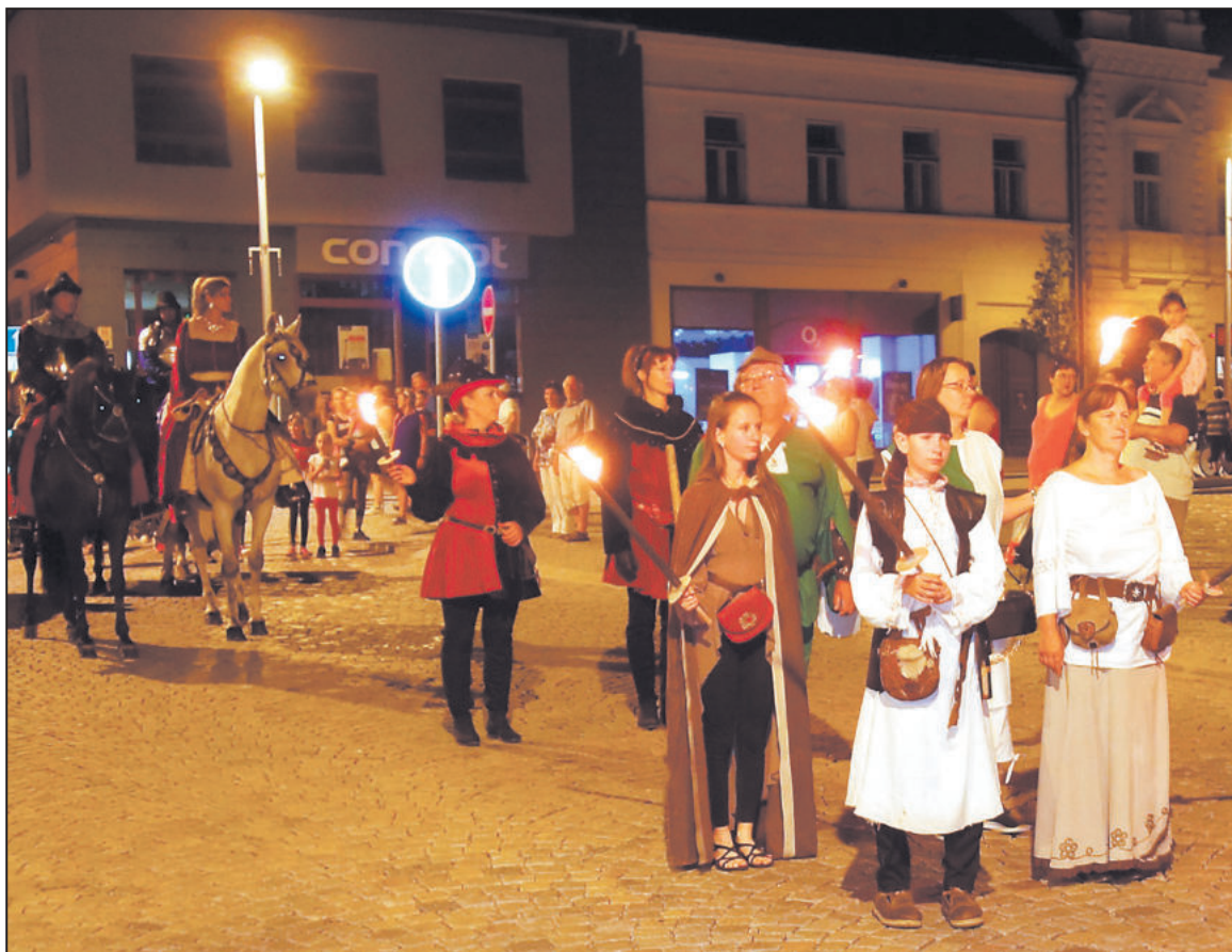
SLAVNOST TŘÍ KÁPI. Historickým průvodem Třebíči vyvrcholily oslavy Tří kápí. Pestrý program se uskutečnil na Podzámecké nivě a také na nádvoří zámku, kde se uskutečnil koncert.