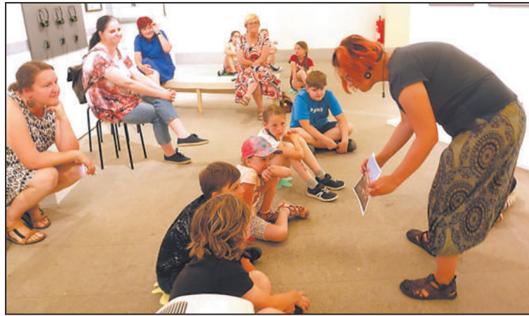
SOUČÁSTÍ výstavy Otisky Staré Říše se stala dětská vernisáž, která přitažlivou formou s expozicí seznámila malé návštěvníky.