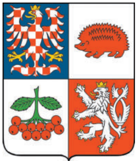
OFICIÁLNÍ znak Kraje Vysočina

Volby do celkem 13 zastupitelstev krajů se v ČR konají každé čtyři roky. Minulé krajské volby proběhly 2. a 3. října 2020, to v době pandemie onemocnění covidem-19. Voličům