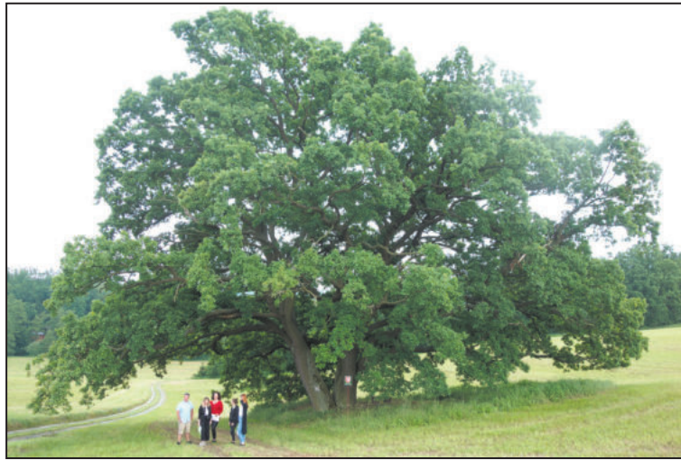
JAKUBA MERTLA upoutal dub u řeky Jihlavy a přihlásil ho do soutěže Strom roku.

ství po triadvacáté. Zástupce, kteří si přijeli strom prohlédnout, strom překvapil dvěma kmeny a bohatou korunou. Pod stromem se nachází lavička a okolí bylo vzorně posečené.