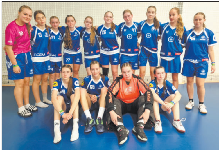
MEZI STÁLICE trebičských florbalistů patří toto družstvo děvčat.

Soupeře chlapci porazili vysoko 8:2 a ovládli skupinu bez prohry. Ješ-