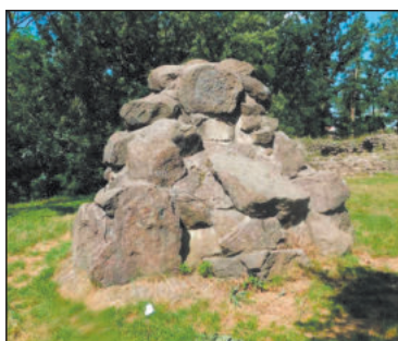
ŽIŽKOVA mohyla na Hrádku.

Žižkovi bojovníci se rozložili na Hrádku a kolem rybníka Kuchyňky. Když se záhy nato do tábora dostavili poslové z východní Moravy s prosbou, aby husité přispěchali