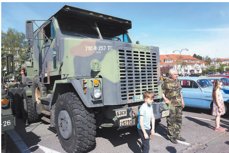
MOHUTNÝ tahač zcela zastínil ostatní vozidla na ploše.