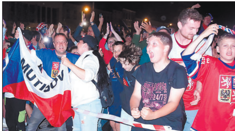
FANOUŠCI se dočkali a společně oslavili zlato z mistrovství v hokeji.