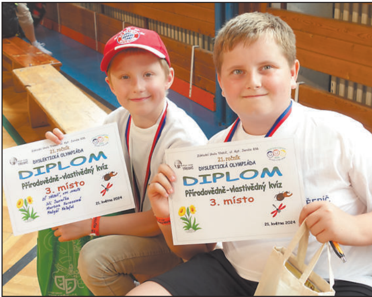
TITO dva chlapci z domovské základní školy se radovali z třetího místa, ale vítězi byli všichni.

Dyslektická olympiáda v Třebíči se skládala z pěti různorodých disciplín.