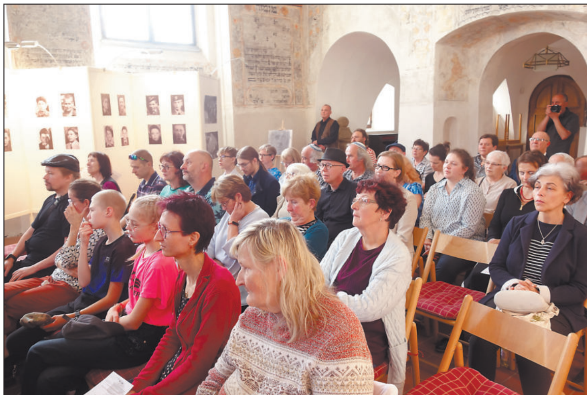
V ZADNÍ synagoze se shromáždili lidé, kteří si připomněli dva transporty Židů z Třebíče.

Po smrti manžela vedla Eleonora na trebičském náměstí v domě číslo popisné 12 obchod provozova-