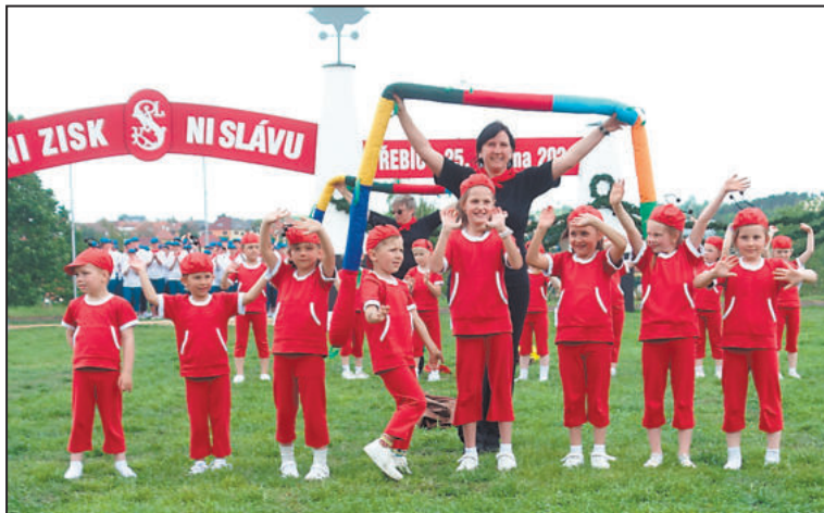
VYSTOUPENÍ dětí mělo mezi diváky velkou odezvu. Jmenovalo se Mravenci.