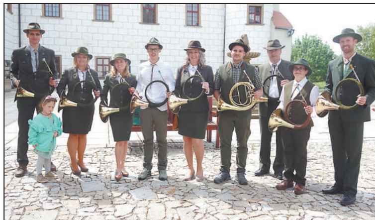
TRUBAČI z Bažantnice (na snímku) si zatroubili před bazilikou společně s kolegy Babylonskými trubači.

Myslivercký víkend a chovatelská přehlídka trofejí se konaly od pátku 3. do neděle 5. května v areálu Kulturního domu Bažantnice – Třebíč. Akce pořádal Okresní myslivecký spolek Třebíč ve spolupráci s radnicemi v Třebíči, v Moravských Budějovicích a v Náměšti nad Oslovou.