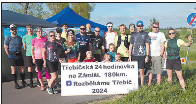
VŠICHNI účastníci běhu na okruhu u rybníka Zámíš těsně před startem.

Ačkoli se mi hned od začátku běželo dobře, měl jsem docela strach, jak budu zvládat noc, protože ta bývá většinou nejnáročnější. Jenže, jak zapadlo slunce a po 21. hodině se setmělo, vše začalo nabírat úplně jiný, ale hlavně neočekávaný směr.