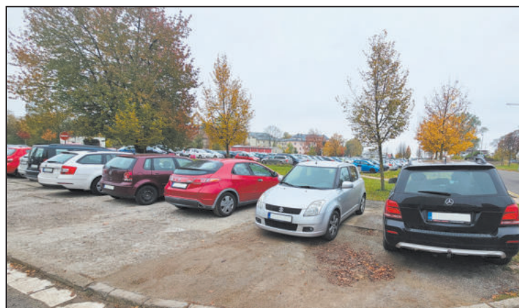
Ilustrační foto: archiv JL

Ve článku JL bylo mimo jiné uvedeno: „Kvůli nastavenému maximálnímu limitu 100 korun za den bylo parkoviště na plochách P1 vítanou zastávkou pro motoristy dojíždějící do krajské metropole za prací. Kdyby svůj vůz odstavili na placeném parkovišti kdekoliv ve městě, parking za jednu pracovní