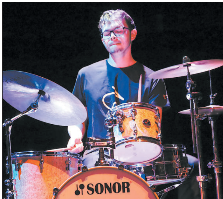
JEDEN z členů Drummin Tria.