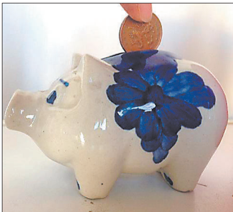
Ilustrační foto: archiv JL

„Průzkum se také zaměřil na otázku, v čem lidé spatřují výhody sdílených aut. 54 % respondentů hodnotí pozitivně to, že se nemusí starat o vlastní auto, řešit jeho výběr, nákup, údržbu, pneumatiky, mytí apod. 46 procentům respondentů se líbí, že nemusí investovat vlastní finance do pořízení vozu. 25 % hodnotí sdílení aut jako věc, která jim přináší svobodu a flexibilitu. 12 % lidí pak díky možnosti využívání sdílených aut nemusí pořizovat druhé auto do rodiny,“ dodává Milan Beutl z Anytime.