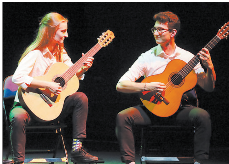
DVA z kytarového kvarteta, které zahrálo Billie Jean od Michaela Jacksona.