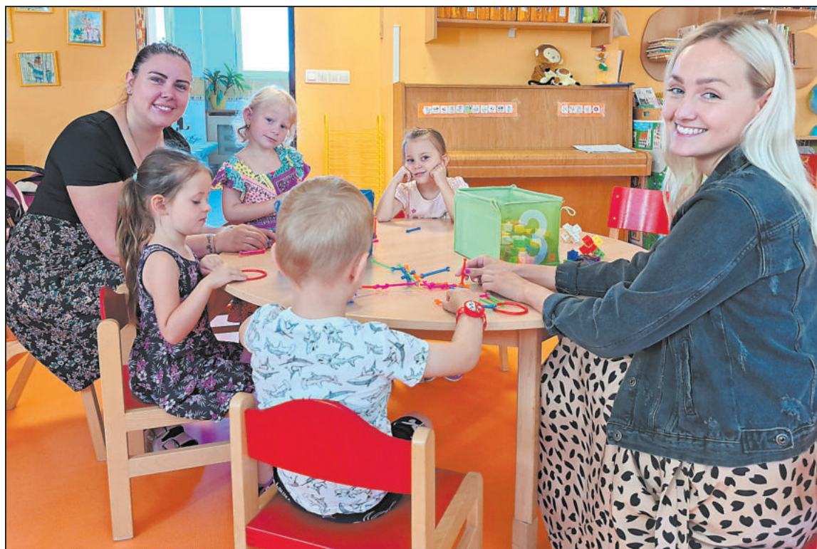
DĚTI ve školce často smutní po rodičích, a tak se je učitelky snaží zabavit, aby se lépe adaptovaly. Což se prý zatím vždy podařilo.

Simona: Očekává se, aby děti zvládaly základní dovednosti, mezi které patří například dojit si na toaletu, umět se obléknout a svléknout, komunikace. Často se stává,