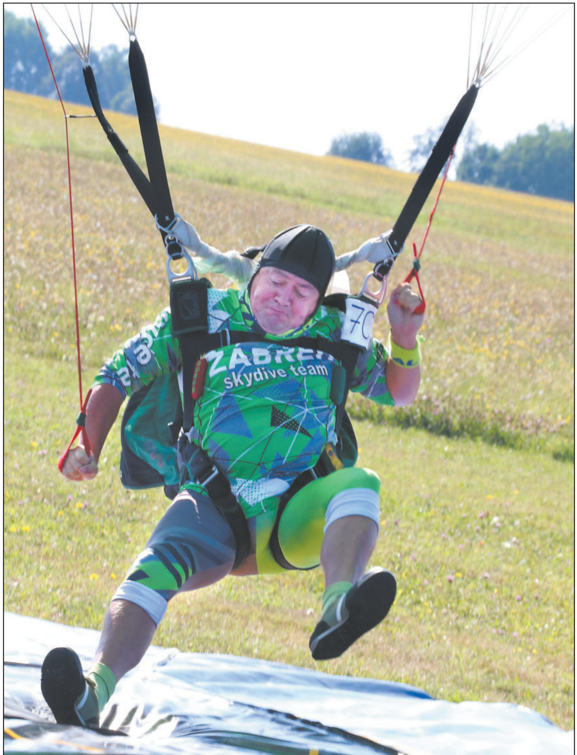
HENČOVSKÉ letiště hostilo elitní parašutisty. V srpnu se zde konalo Mistrovství republiky v akrobacii a seskoky na přenosnost přistání.

■ Budou krajské volby, a až vždycky všichni politici ubezpečují, že budou kopat za celou Vysočinu, mnohdy kopou především za své město, z něhož vzešli. A tak je v zájmu každého většího města, aby tam mělo co nejvíc svých zástupců. Pochopili jste? -pk-