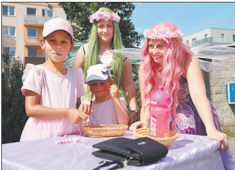
KRÁSNÉ víly s barevnými vlasy.