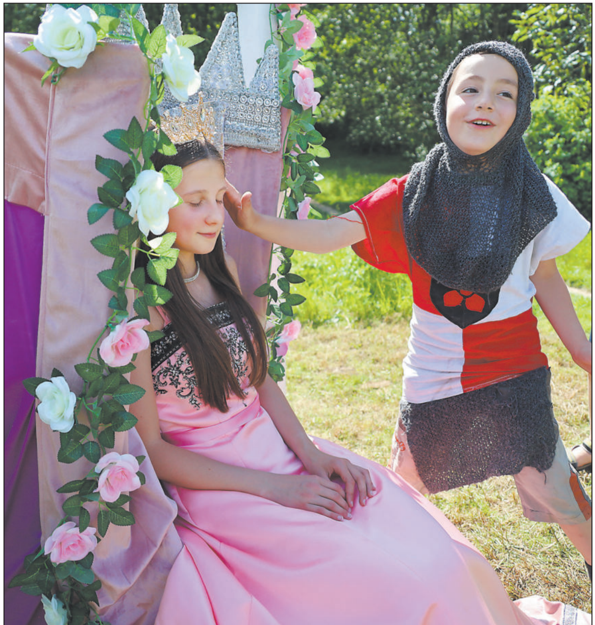
ŠÍPKOVOU RŮŽENKU mohly děti probudit ze stoletého spánku pohazením. Všem se to podařilo, jak jinak. Pohádková cesta v Hruškových Dvorech se nesla v duchu dokonale připravených kostýmů a rekvizit.