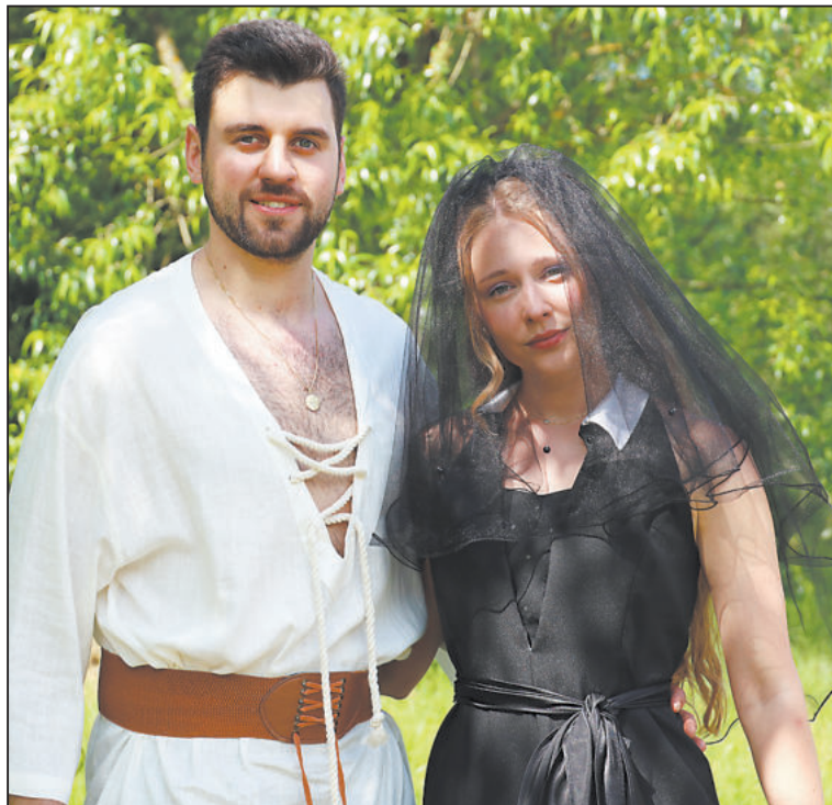
DOKONALÁ Šíleně smutná princezna.