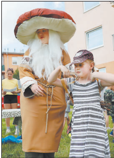
KDO by neznal Dědečka hříbečka z pohádky Mrazík.