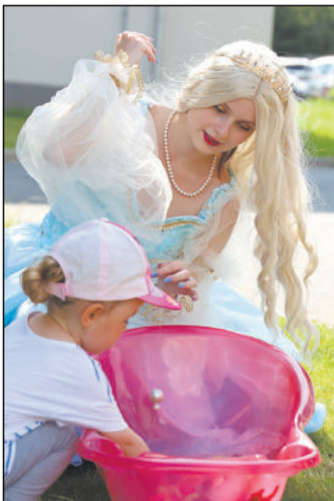
PŮVABNÁ Zlatovláska, nebo že by to byla Popelka, přebírající hrách?