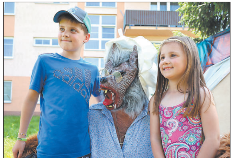
VLK z Červené karkulky vypadal hrůzostrašně, ale jinak se s dětmi rád vyfotil.