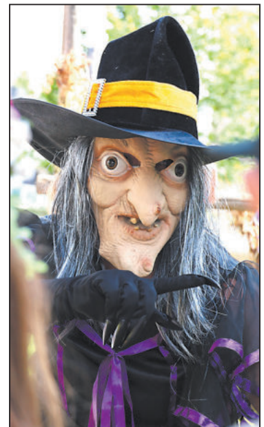
PERNÍKOVÁ chaloupka jako vyšitá a dvě dívky, které jdou loupat perniček. A chybět tu nemohla ani čarodějnice (dole).