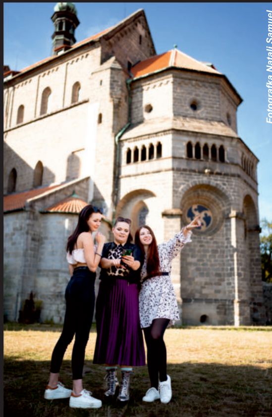
Fotografka Natali Samuel