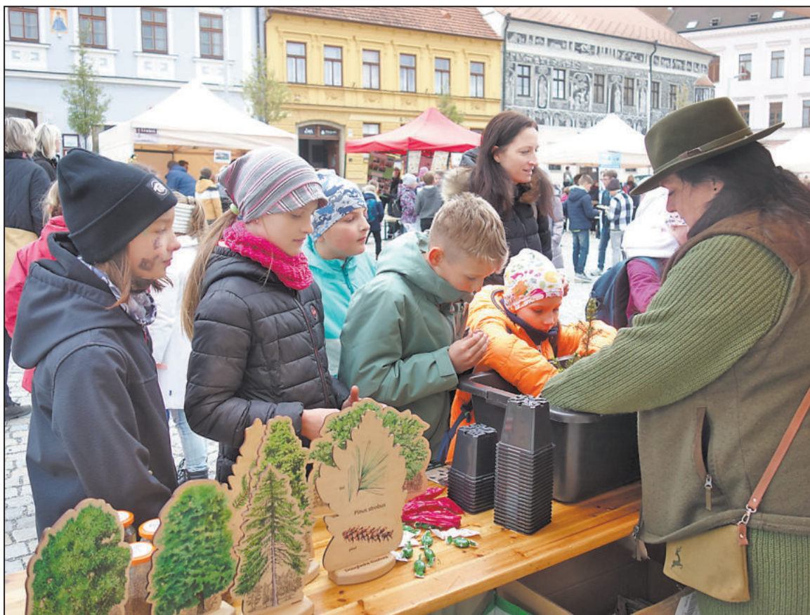
DEN ZEMĚ. Na Karlově náměstí v Třebíči se konal Den země, který zejména nejmladší generaci seznámil s ochranou přírody. Mezi největší atrakce patřila možnost zasadit si vlastní strom.

Antonín Kalina a děti Buchenwaldu, 36 podobizen osvobozených dětí a jejich životopisných údajů, výstavu s tímto názvem potrvá v třebíčské Zadní synagoze do 30. června letošního roku. -zt-