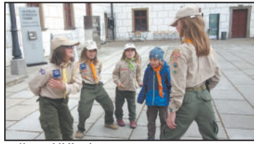
TŘEBÍČSTÍ skauti se nemusejí obávat, že by mezi dětmi nebyl o jejich činnost zájem.

Návštěvníci nahlédnou do starých kronik, záplatovaných stanů a nasají vůni táborových ohňů. Připomenou si příběhy tábořišť, desítek a stovek obětavých vedoucích, tisíců malých skautů a skautek, miliony vyluštěných šifer a nalezených pokladů a nespočet otlučených ešusů.