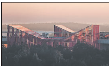
JEDEN z oceněných návrhů, který vypracovalo Sdružení JIKA-CZ+ohboi+Valbek.

Výsledek? Odborníci vybrali návrh č. 17. Škoda, že na konci prohlídky nebyl sešit, kam by lidé mohli přiřadit svůj hlas některému z návrhů. Ať už by se s odborníky shodli, či ne, jedno je jisté: Na perónu „vrtky“ bude stejně profukovat, zvláště tady na Vysočině. -pk-