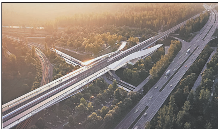
VÍTĚZNÝ návrh AREP-AREP Architectes-Monom.

V případě vstupní haly ještě možná dokážeme trochu rozpoznat praktičnost pro cestujícího, ale vymyšlení a funkčnost křížení silnic a železnic už ne. Takže zbývá jen to hodnocení líbí, nelíbí.